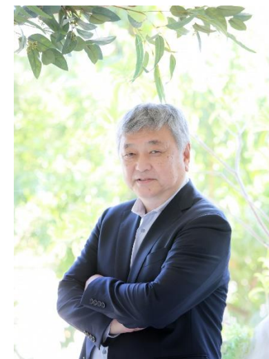
オール日本スーパーマーケット協会 会長

「教育」「商品」「情報」の3つの側面から会員企業をサポートすることによって、会員企業が繁栄し、ひいてはスーパーマーケット業界全体が発展するよう各活動を活発に展開して参ります。