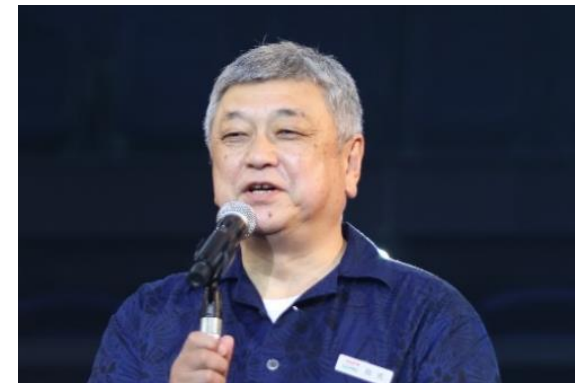
オール日本スーパーマーケット協会 会長

「教育」「商品」「情報」の3つの側面から会員企業をサポートすることによって、会員企業が繁栄し、ひいてはスーパーマーケット業界全体が発展するよう各活動を活発に展開して参ります。