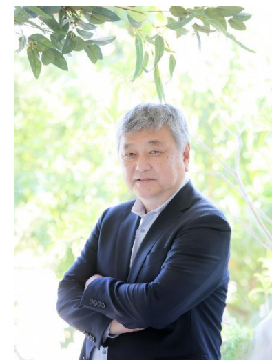
コプロ株式会社 代表取締役社長

スーパーマーケットは地域の生活者にとって欠かせない社会的インフラとして重要な役割があります。当社は使命である「AJS会員企業の繁栄に貢献する」を実現し、地域の生活者を支えるAJS会員企業をバックアップしていきたいと考えています。